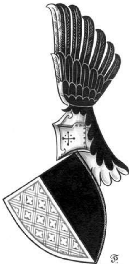
Erb rodu z Michalovic ze 13. století

Nám z Mjůzik klubu už dlouhou dobu vrtala v hlavě nešťastná smrt Jana III. z Michalovic, o které se zpívá v oblíbené táborové písni „Hrádeček“. Když zapátráme po původu tohoto dílka, zjistíme, že na svět přišlo ještě za časů minulých harcovnických generací, v dobách staroslavné Kytlice. Ten příběh je známý: oblíbený pán kamenného hrádečku, Jan III. z M., vládne milován svým lidem. Sedm let je to OK, osmého léta už moc ne, někdo oblehl hrad, podplatil Janova zbrojnoše a ten školní fintou „hele támhle“ zabavil a zbavil chudáka Jana III. života vezdejšího. Potud píseň. Když ale konfrontujeme text s historickými prameny, tak ouha! Zalistujme prapředkem všech českých encyklopedií, autoritou nejvyšší - Ottovým slovníkem naučným, čili jak