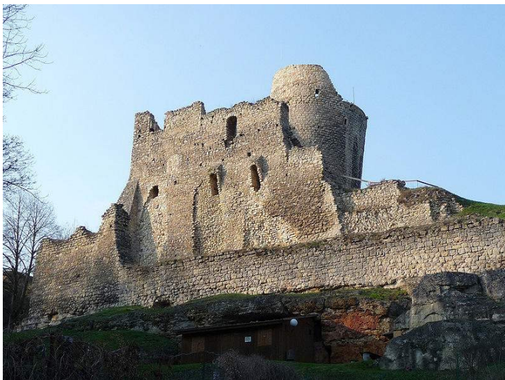
Hrad Michalovice dnes

Apelujeme tedy na pamětníky (ne pamětníky husitských válek, ale pamětníky vzniku písňe), pište na adresu redakce a pomozte nám rozřešit tuto záhadu!